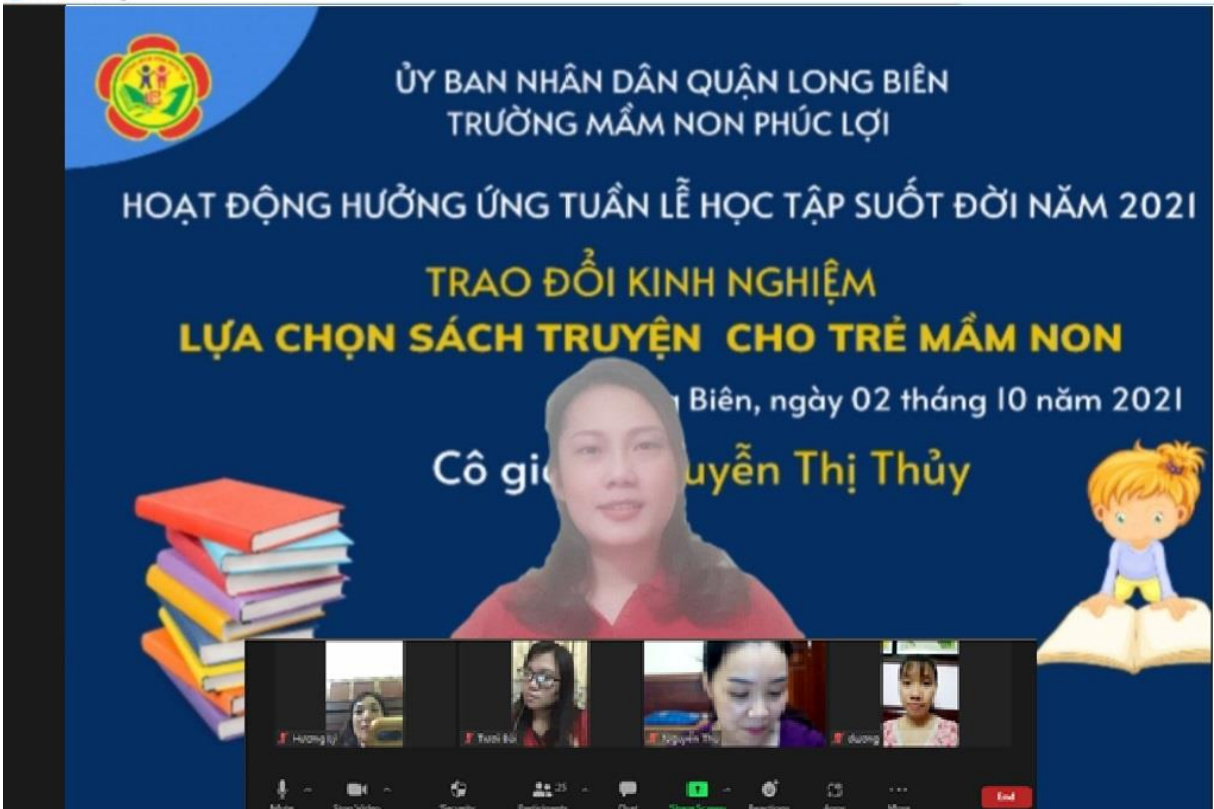
( Ảnh Cô giáo hướng dẫn phụ huynh lựa chọn sách qua zoom)