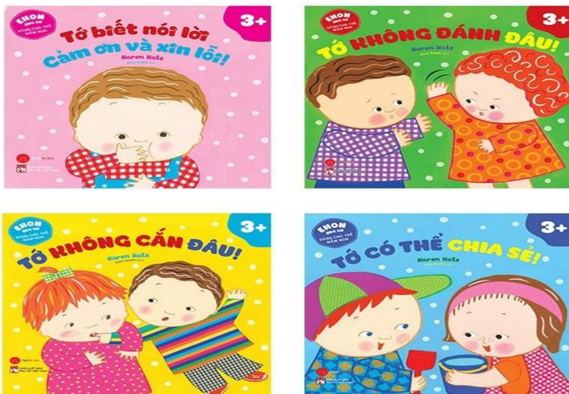
( Sách ehon cho trẻ 3-4 tuổi )