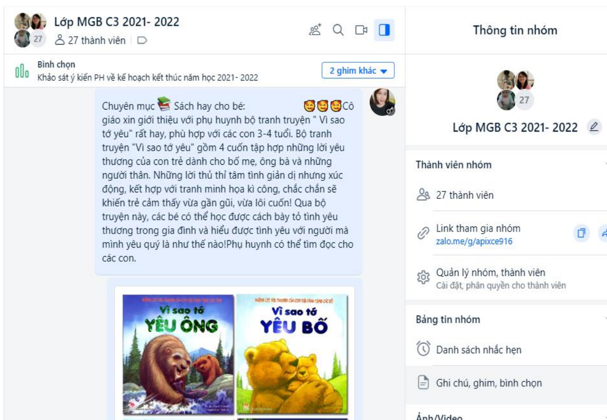
( Ảnh Cô giáo giới thiệu một số cuốn sách hay trên zalo nhóm lớp)