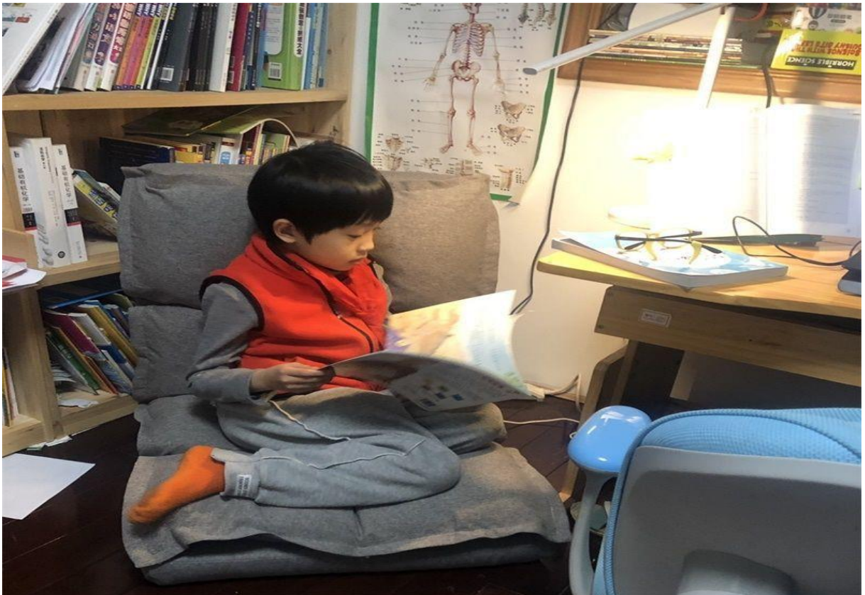
( Ảnh phụ huynh tạo tủ sách, không gian tranh truyện tại nhà)