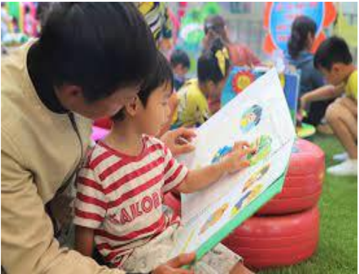
( Ảnh phụ huynh hướng dẫn trẻ đọc tranh truyện)