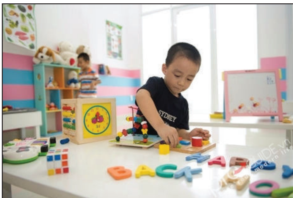
Trẻ chú động trong chơi đồ chơi