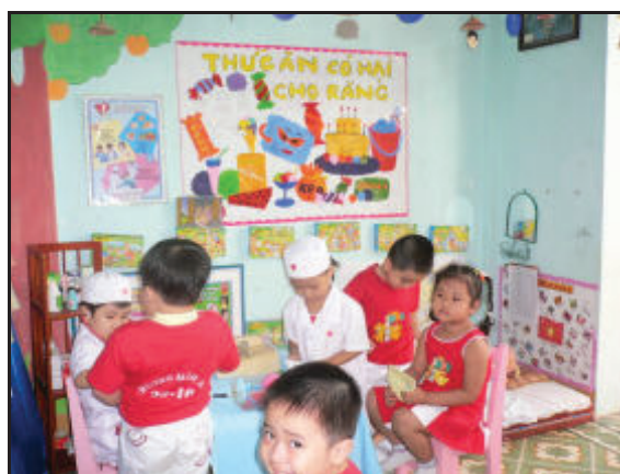
Bé tập làm bác sĩ

Đóng vai là phương pháp tổ chức cho trẻ “làm thử” một số cách ứng xử nào đó trong một tình huống giả định. Đây là phương pháp nhằm giúp trẻ suy nghĩ sâu sắc về một vấn đề bằng cách tập trung vào một sự việc cụ thể mà trẻ vừa thực hiện hoặc quan sát được. Việc “diễn” không phải là phần chính của phương pháp này mà điều quan trọng là sự thảo luận sau phần diễn ấy.