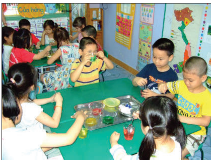
Các cháu Trường Mẫu giáo Việt – Bun, Hà Nội đang hoạt động khám phá