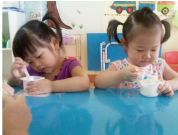
Bé tự xúc ăn