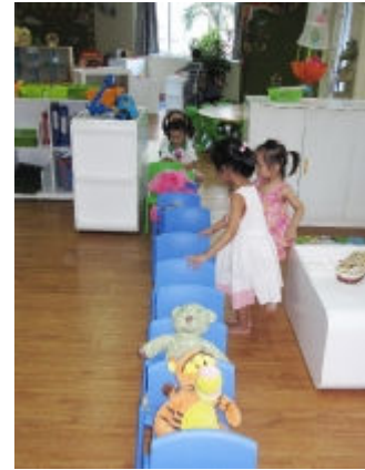
Đoàn tàu tí hon