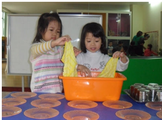
Minh cùng trực nhật nha!