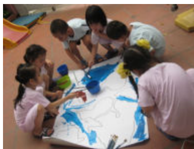
Chúng mình cùng vẽ chung một bức tranh nhé!