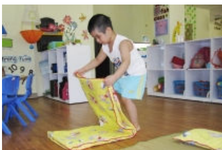
Bé gấp chăn gối ghê!