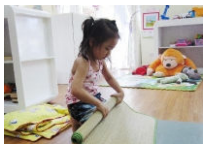
Gấp chiếu thật là dễ!