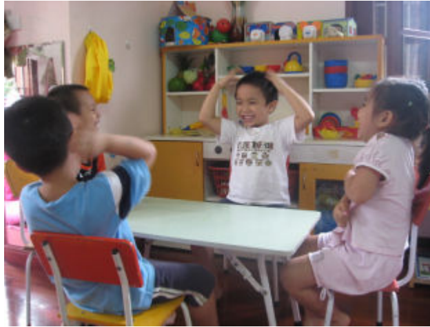
Cùng trò chuyện vui ghê!