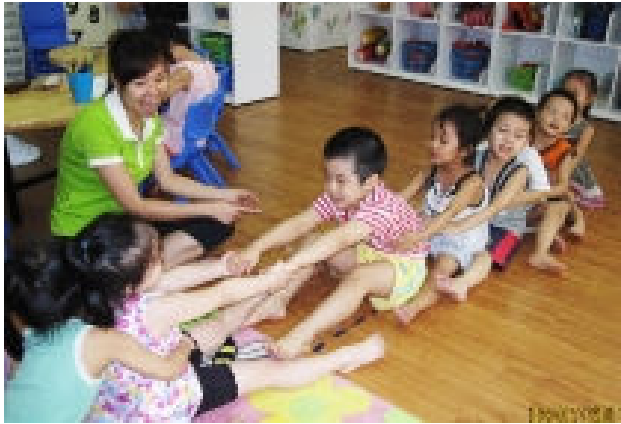
Kéo cưa lừa xẻ Vui về cả nhà...