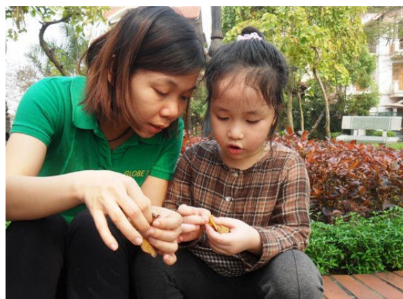
Trò chuyện về cách làm nghề lá đa.