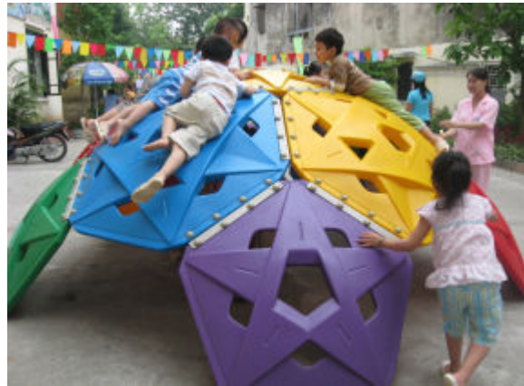
Chúng mình cùng trò chơi!

trò chơi xây dựng, trò chơi đóng kịch, trò chơi trí tuệ. Trẻ chơi các trò chơi để thực hành kĩ năng sống.