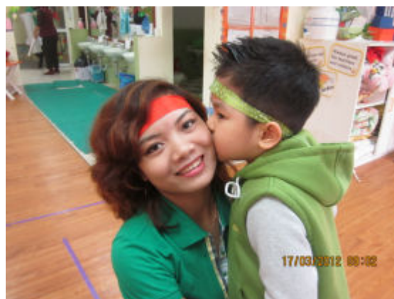
"Con yêu cô nhiều nh usao trên trời"

2) Nhóm kĩ năng quan hệ xã hội , bao gồm các giá trị như: thần thiện , gồm các kĩ năng về kết bạn, hoà giải xung đột, giúp đỡ, nhường nhịn; yêu thương , gồm các kĩ năng về quan tâm, chia sẻ buồn, vui, khó khăn, thành công, thất bại...; biết ơn , gồm các kĩ năng về giữ gìn đồ vật, ghi nhớ sự đóng góp, đền ơn đáp nghĩa, tiết kiệm; tôn trọng , gồm các kĩ năng về thực hiện các quy tắc xã hội, chấp nhận sự khác biệt, công bằng, kính trọng người lớn.