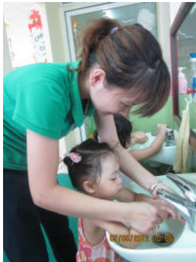
Bé cùng rửa tay với cô nào!