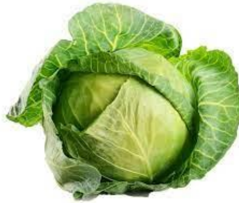
Rau bắp cải