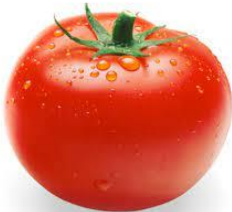
Quả cà chua