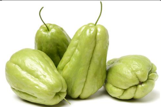
Quả su su