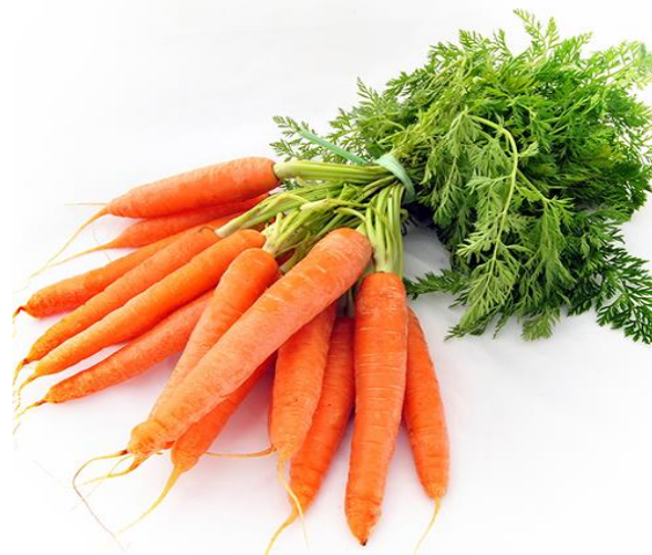
Củ cà rốt