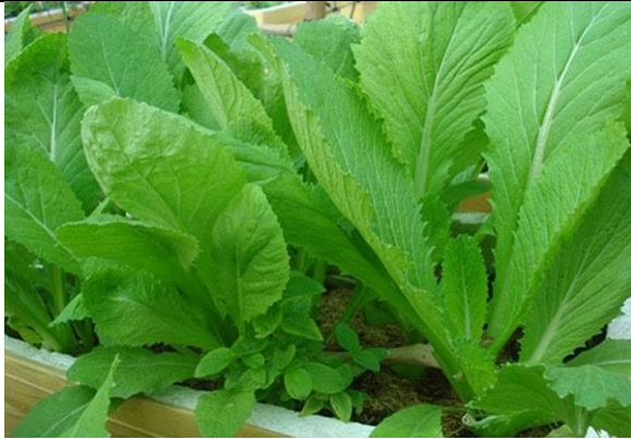
Rau cải xanh

* BỐ (mẹ) hãy cho bé quan sát và kể tên các loại rau sau: