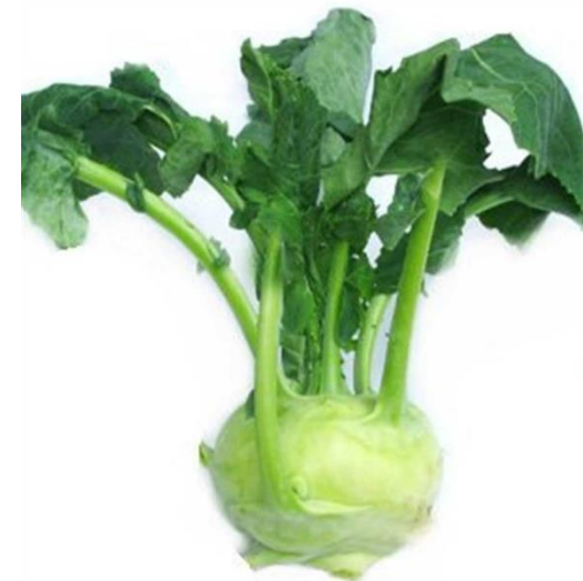
Củ su hào