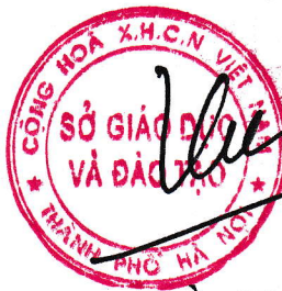
Trần Thế Cường