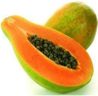
Quả đu đủ