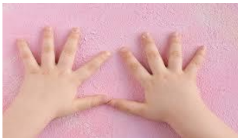
Đôi tay của bé