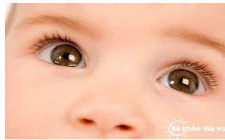
Đôi mắt của bé

Bé hãy bấm vào link để được tương tác với câu hỏi nhé: https://www.liveworksheets.com/jz2455969yi