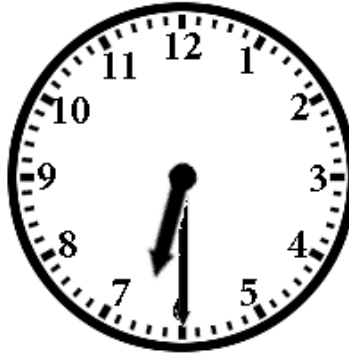
2. Half past six