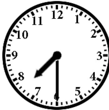
5. Half past seven