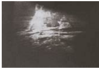
Cảnh hạ cánh xuống mặt trăng do cha tôi chụp từ tivi của chúng tôi.

Chúng tôi vẫn giữ bức ảnh này trong một cuốn album.