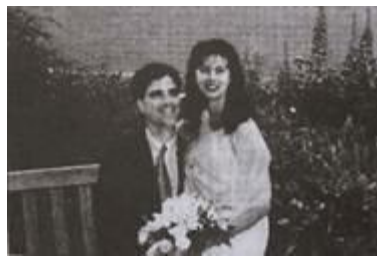
Ảnh chụp trước khi chúng tôi lên khinh khí cầu.

Người lái khinh khí cầu cho bớt không khí ra. Ông kéo tất cả cần gạt, chỉ muốn hạ xuống thật nhanh. Lúc đó, tốt hơn là ông cho va vào một ngôi nhà gần đó thay vì va vào đoàn tàu đang chạy nhanh.