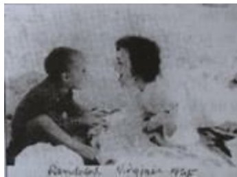
Mẹ và tôi trên bãi biển

Theo một cách nào đó, với sự trôi đi của thời gian, và những mốc hẹn mà cuộc sống áp đặt, đầu hàng đôi khi là việc đúng đắn nên làm.