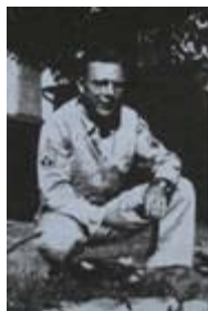
Cha tôi trong bộ quân phục

Trong năm mươi năm cha mẹ tôi sống với nhau, trong hàng ngàn cuộc chuyện trò của cha với tôi, sự việc này chưa bao giờ được ông nhắc tới. Và giờ đây, vài tuần sau khi cha mất, chúng tôi mới được biết về nó. Lại thêm một bài học của cha tôi về ý nghĩa của sự hy sinh và về sức mạnh của lòng nhân đạo.