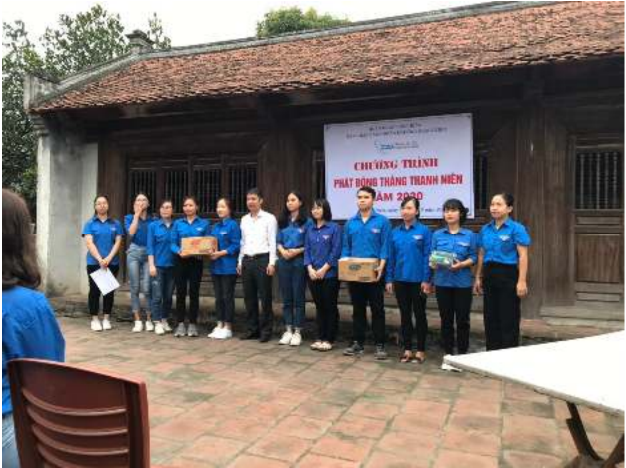
Đoàn viên trong Chi Đoàn tham gia các Hoạt động cùng Đoàn phường Giang Biên

BGH Đoàn đã tổ chức dạy học lớp cảm tình Đoàn cho HS đủ điều kiện tham gia với học sinh khối 9 qua dạy học trực tuyến đạt hiệu quả tốt. 100% học sinh tham gia học đã viết bài thu hoạch đạt kết quả tốt. Qua đó đã lựa chọn được những học sinh ưu tú để chuẩn bị kết nạp vào Đoàn TNCS Hồ Chí Minh.