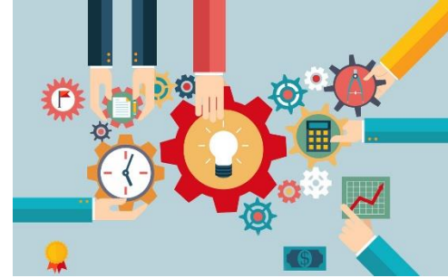
Chi phí vận hành