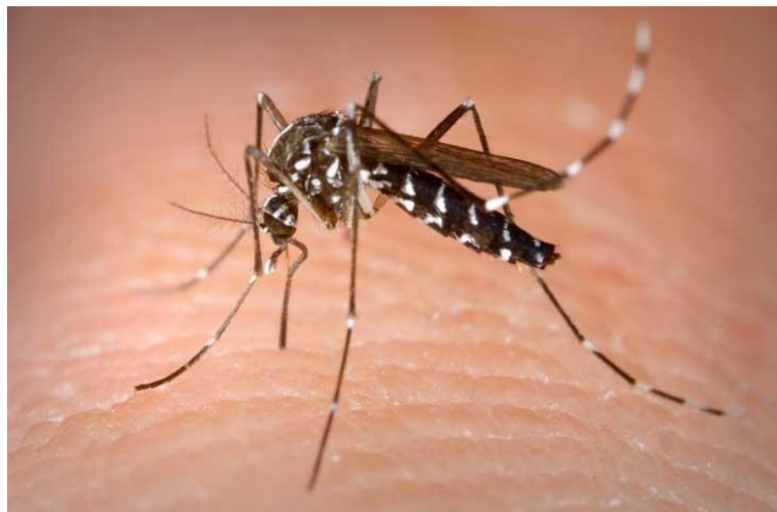
Muỗi vằn chứa virus Dengue là nguyên nhân gây bệnh sốt xuất huyết

Việt Nam nằm trong vùng khí hậu nhiệt đới ẩm gió mùa nên muỗi vằn sinh sản rất nhiều. Hai khoảng thời gian này cũng chính là thời điểm bùng phát mạnh mẽ dịch sốt xuất huyết tại miền Bắc. Còn ở miền Nam, bất kỳ thời gian nào cũng có thể xảy ra dịch sốt xuất huyết do sự phân bố dày đặc của muỗi vằn.