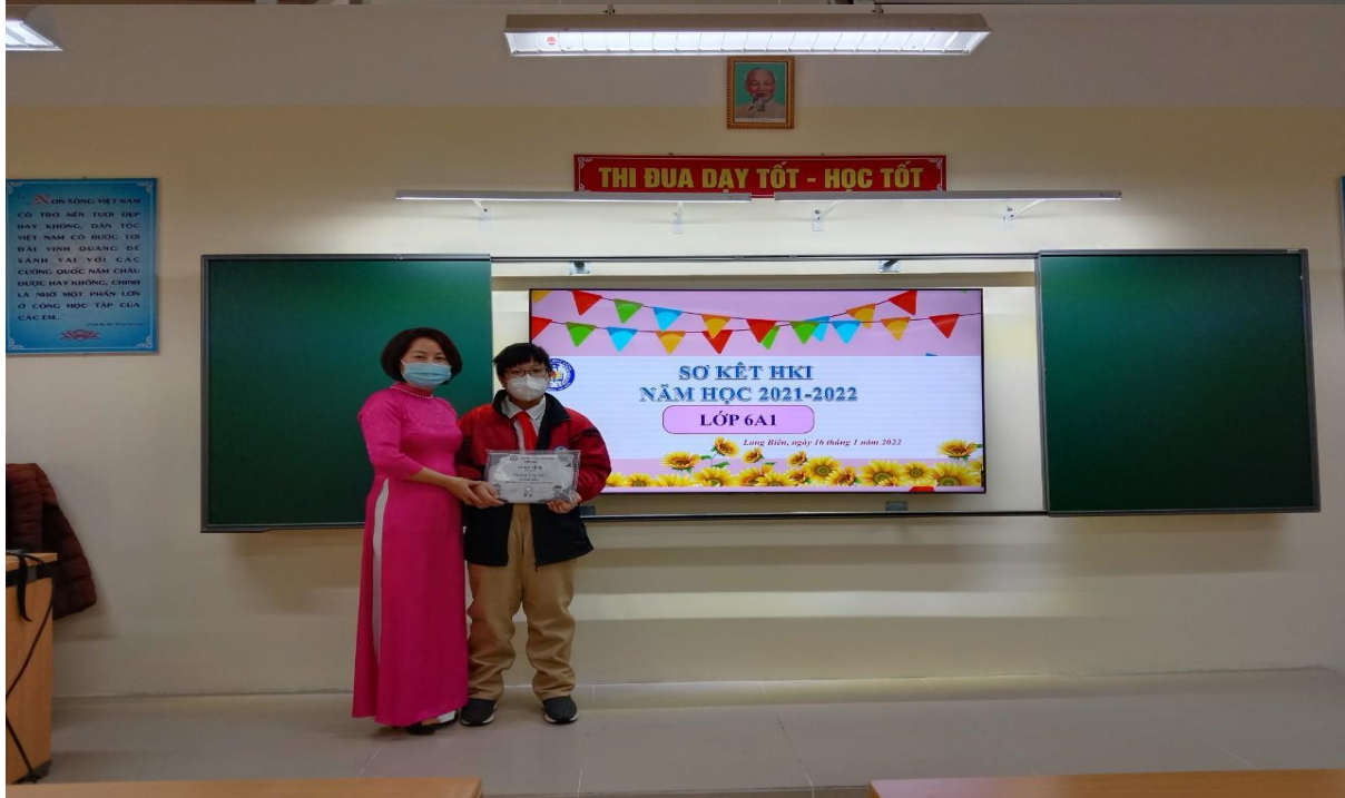
TRƯỜNG THCS LÊ QUÝ ĐÔN