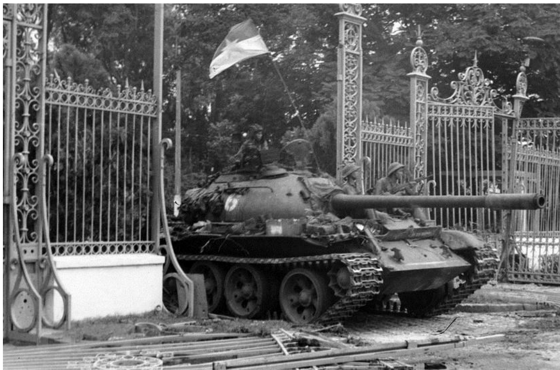
Xe tăng quân Giải phóng tiến vào chiếm Dinh Độc Lập ngày 30/4/1975