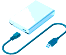
Hình 1.3. Đĩa cứng

Câu 15: Đĩa cứng trong Hình 1.3 là loại thiết bị nào?