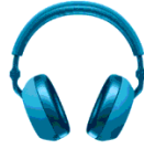
Hình 1.2. Tai nghe

Câu 11: Tai nghe trong Hình 1.2 là loại thiết bị nào?