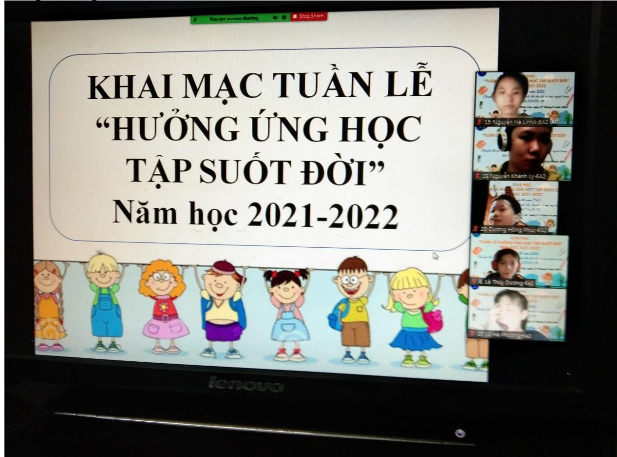
GVCN phát biểu hưởng ứng Tuần lễ học tập suốt đời

Phát động Tuần lễ học tập suốt đời là phát huy truyền thống hiếu học quý báu của dân tộc, để mỗi người dân thấy việc học tập suốt đời là quyền lợi, nghĩa vụ của mọi người trong việc xây dựng một xã hội học tập. Đặc biệt trong thời điểm dịch Covid-19 đang diễn biến phức tạp như hiện nay, việc đẩy mạnh ứng dụng công nghệ thông tin trong tổ chức dạy học ngày càng được chú trọng, nhà trường và các em cần biết sử dụng những lợi thế từ Internet để có thể đạt kết quả tốt nhất trong học tập và làm việc.