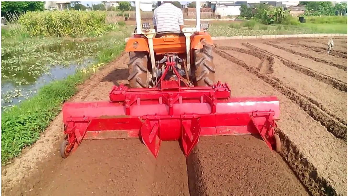
Máy lên luống