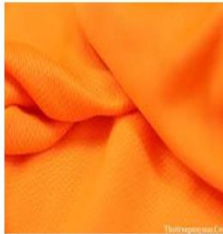
Vải sợi bông