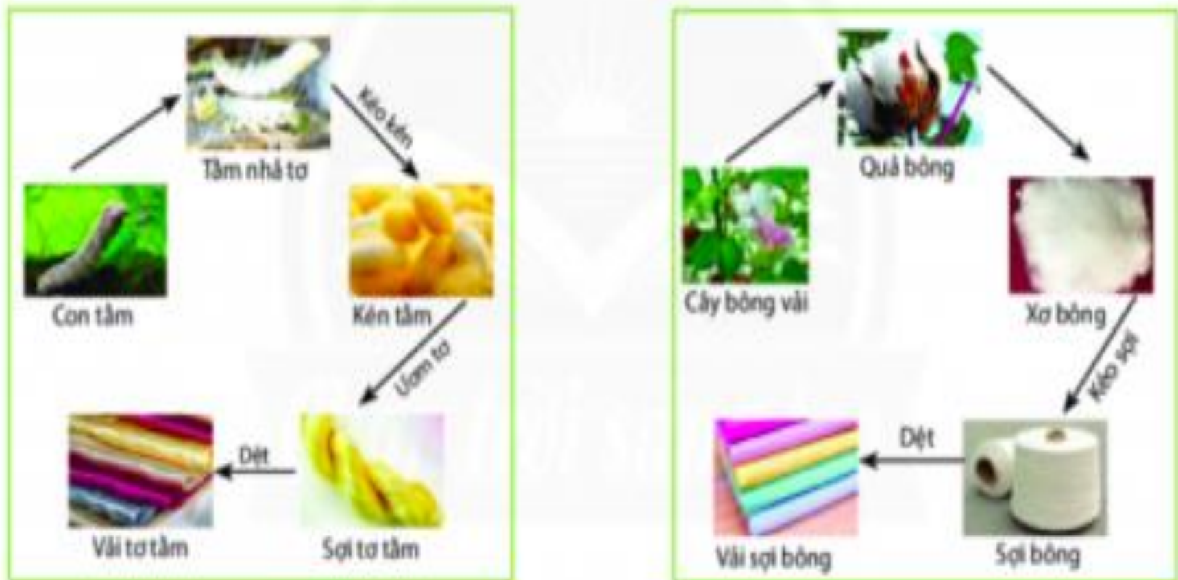
Hình 4.1. Sơ đồ quá trình sản xuất vải sợi thiên nhiên