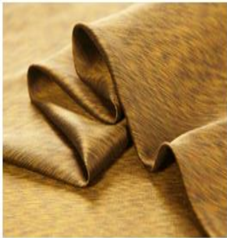
Vải sợi tơ tằm