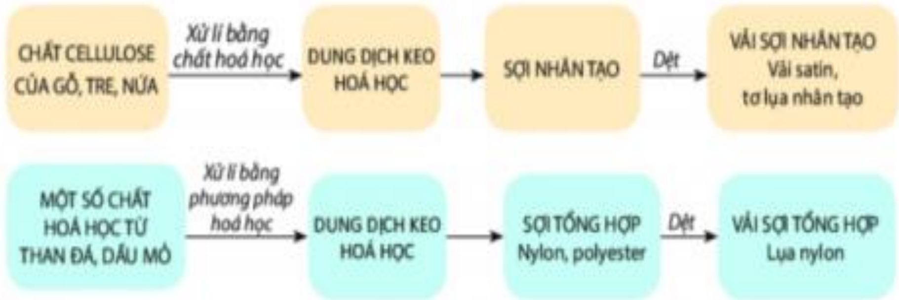
Hình 4.2. Sơ đồ quy trình sản xuất vải sợi hoá học