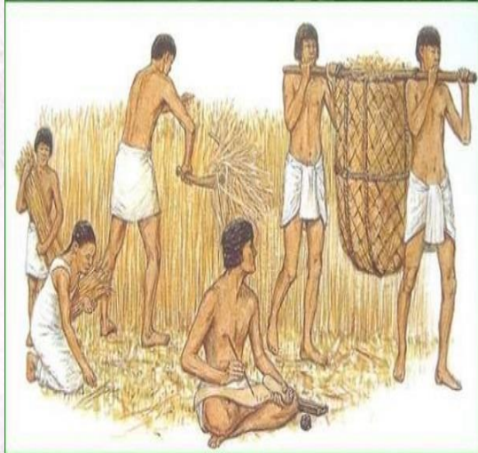
Fig. 13: Thờ kỹ 18 Thời Hậu Lê - Tây Sơn