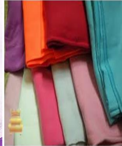
Vải sợi nhân tạo