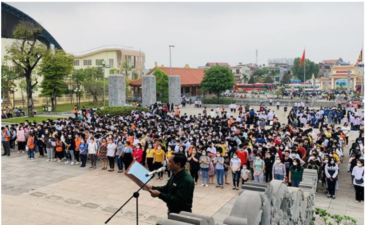
Thầy trò nhà trường lắng nghe phần thuyết minh về Đại đội 915