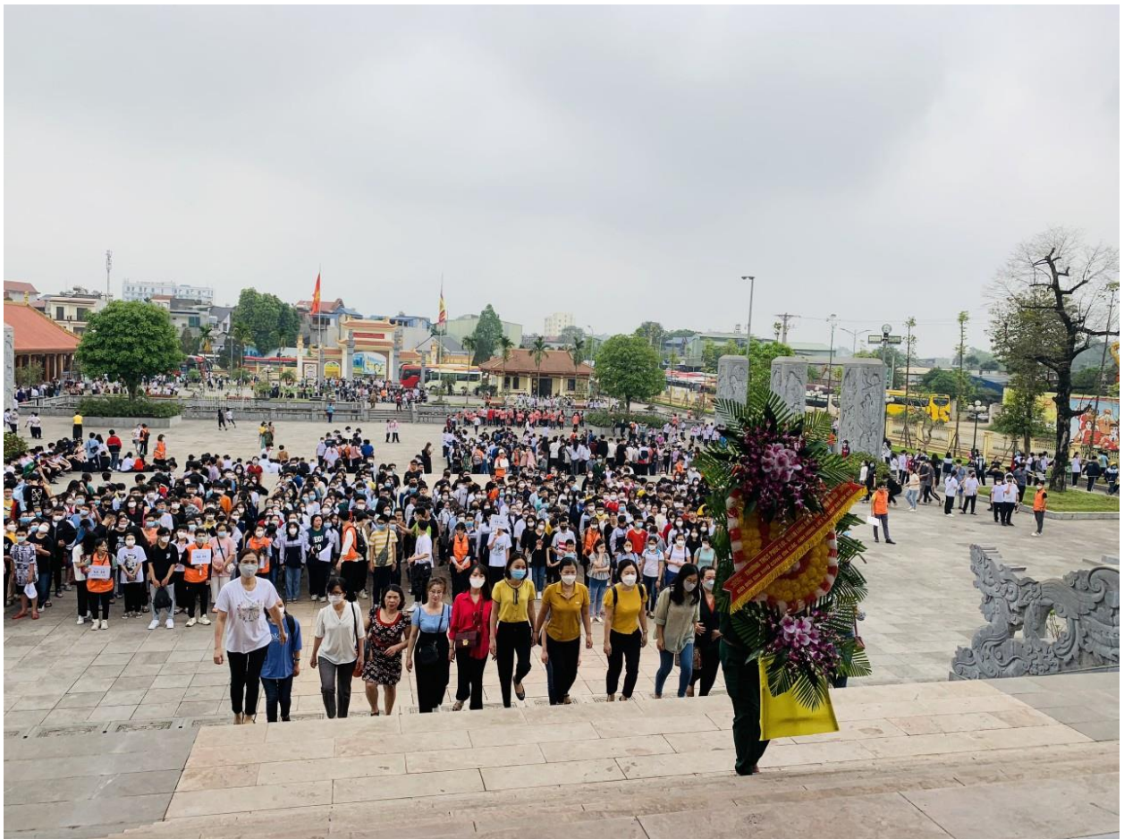
Giáo viên và học sinh trường THCS Phúc Lợi thành kính dâng hoa tưởng niệm các anh hùng liệt sĩ Đại đội 915

Địa điểm đầu tiên mà thầy trò trường THCS Phúc Lợi đến là Khu di tích Đại đội 915 Thanh niên xung phong tại Phường Gia Sàng, Thành phố Thái Nguyên. Đoàn làm lễ dâng hương tưởng niệm các anh hùng liệt sĩ – thanh niên xung phong của Đại đội 915 đã ngã xuống để bảo vệ Tổ quốc. Trong không khí trang nghiêm, xúc động, đoàn trường THCS Phúc Lợi đã kính cẩn đặt vòng hoa, thắp nén hương thơm tri ân công lao to lớn của cán bộ, đội viên Đại đội 915 đã anh dũng hy sinh vì sự nghiệp giải phóng dân tộc, vì độc lập, tự do của Tổ quốc.