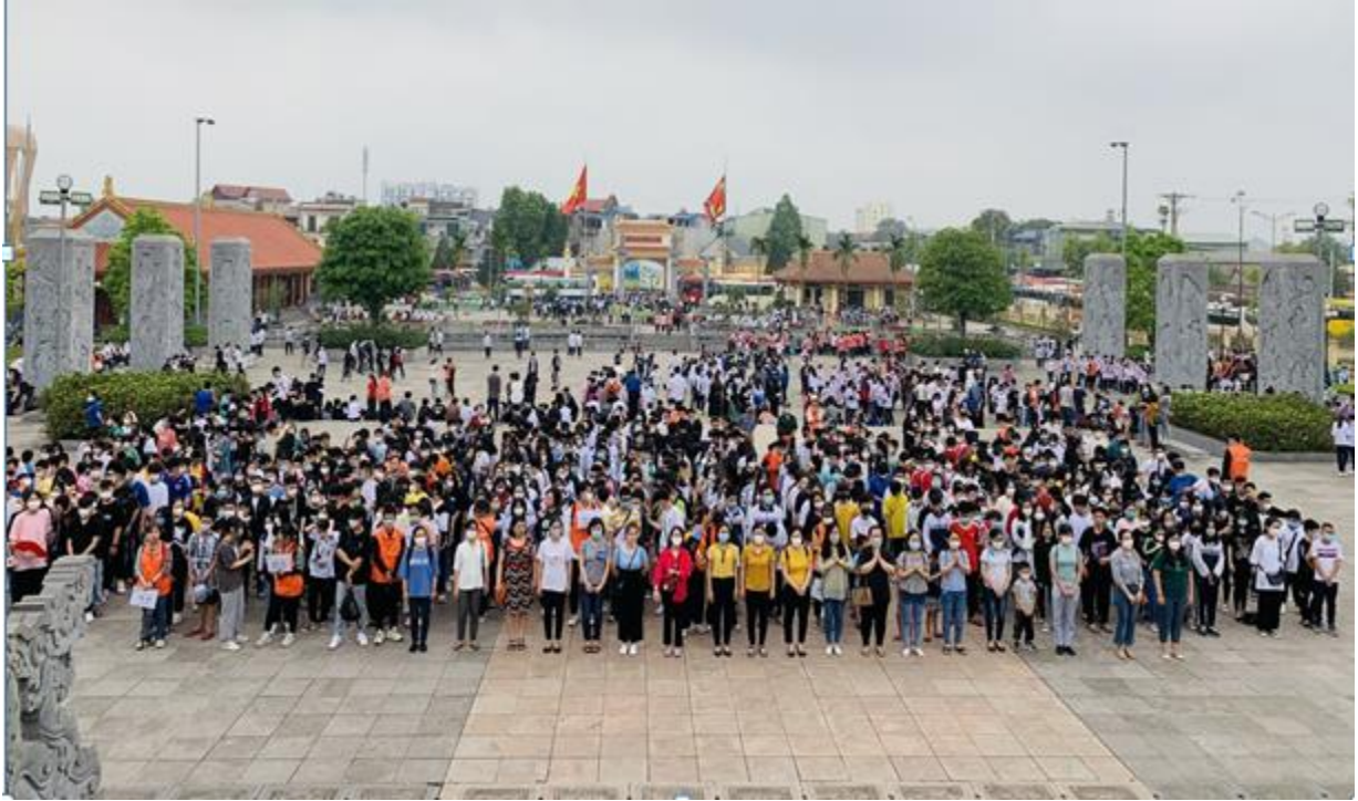
Thầy và trò thành kính tri ân các anh hùng liệt sĩ Đại đội 915

Trong số đó, phần lớn đều là nữ, là người dân tộc thiểu số, tuổi đời mười tám, đôi mươi. Sự hy sinh của các anh, các chị là tổn thất to lớn ở mặt trận hậu phương trong thời kỳ kháng chiến chống Mỹ, cứu nước. 48 năm đã qua, ký ức đã xa nhưng sự kiện đêm Noel máu lửa đã và đang tiếp tục được tôn vinh để viết thêm một khúc tráng ca, một huyền thoại về lực lượng Thanh niên xung phong giai đoạn chống Mỹ cứu nước. Đoàn đã dành một phút mặc niệm để tưởng nhớ những công lao to lớn của các anh hùng Đại đội 915.