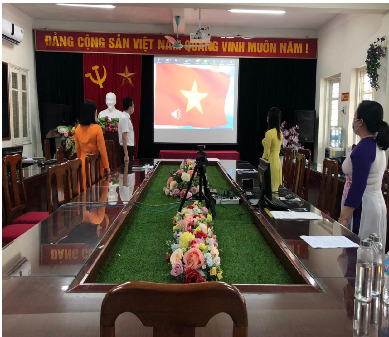
Lễ bế giảng được tổ chức trực tuyến

Lễ bế giảng là sự kiện đặc biệt ý nghĩa để thầy và trò cùng nhìn lại một năm học với những nỗ lực bền bỉ, những thành công và thật nhiều khoảnh khắc đáng nhớ. Năm nay, vì dịch Covid-19, hàng triệu học sinh trên cả nước không thể đến trường dự lễ tổng kết này. Với mong muốn mang đến cho các em học sinh một buổi lễ ý nghĩa nhưng vẫn đảm bảo an toàn trong mùa dịch, sáng nay, ngày 26/7, trường THCS Phúc Lợi đã tổ chức Lễ bế giảng năm học 2020-2021 bằng hình thức trực tuyến.