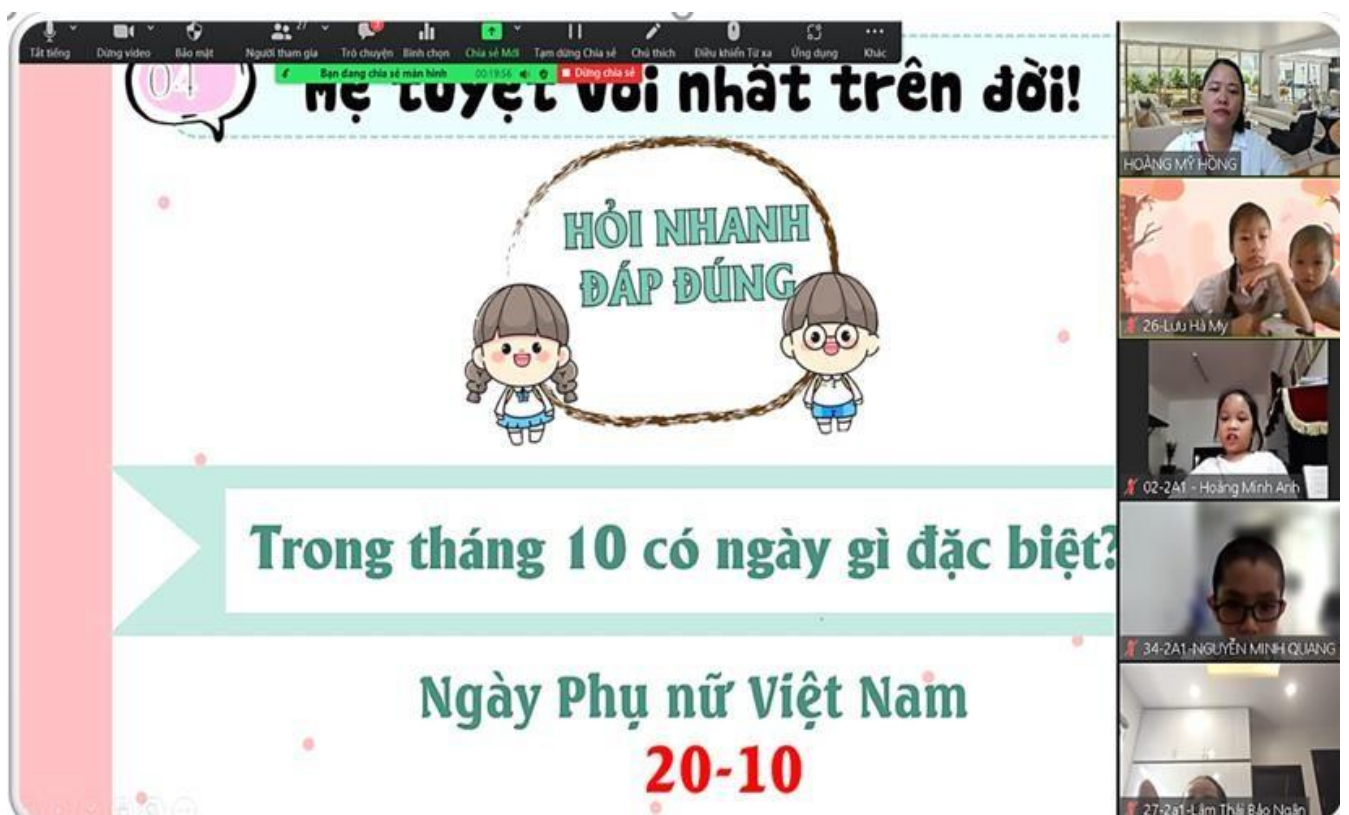
Hình ảnh các hoạt động triển khai trong tiết sinh hoạt dưới cờ đầu tuần.