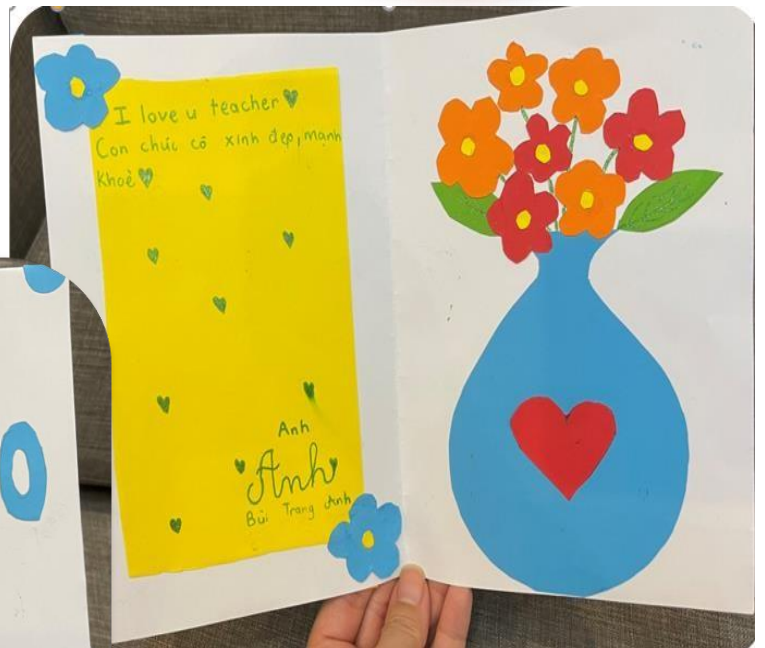
Những tấm thiệp sắc màu, sáng tạo với lời chúc ý nghĩa