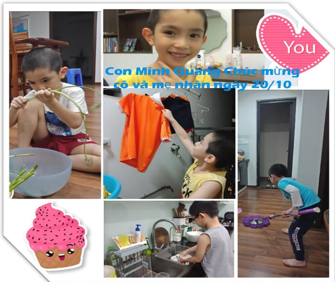
Những đứa con hiếu thảo biết giúp đỡ bố mẹ trong những bức ảnh chụp khoảnh khắc khắc làm việc nhà giúp mẹ