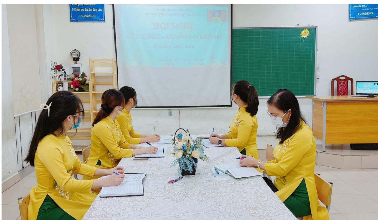
Các thành viên tổ chuyên môn tham dự trực tuyến tại các lớp học