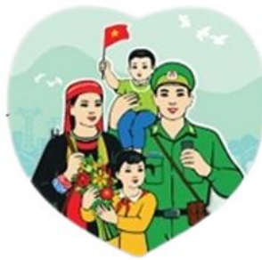
Công tác phục vụ nhân dân