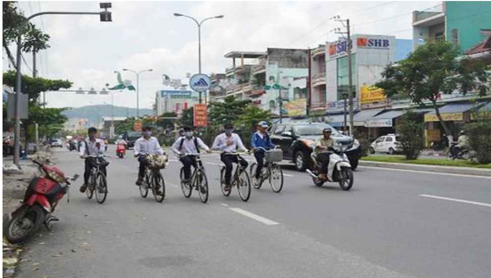
Hình ảnh: Đi xe dàn hàng ngang