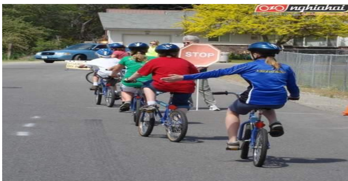
Hình ảnh: Đi xe phải đi hàng một