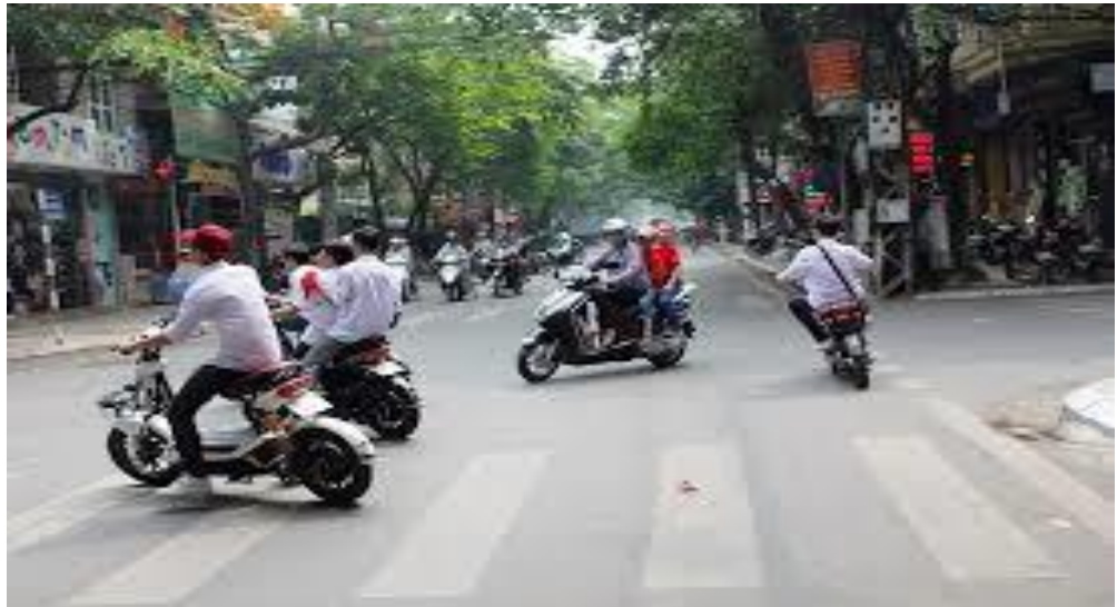
Hình ảnh: lạng lách, đánh võng