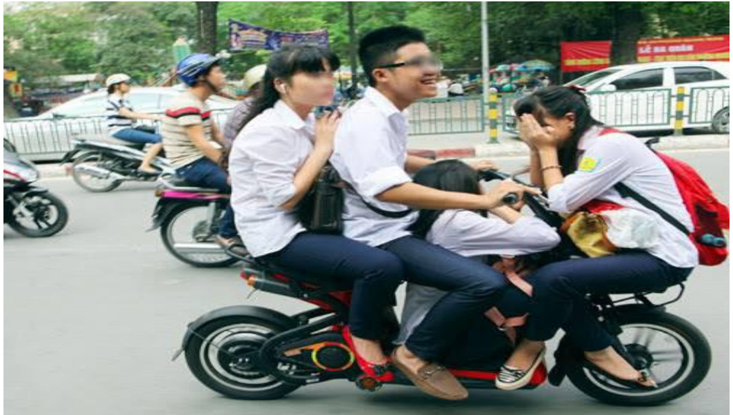
Hình ảnh: đèo quá số người theo quy định