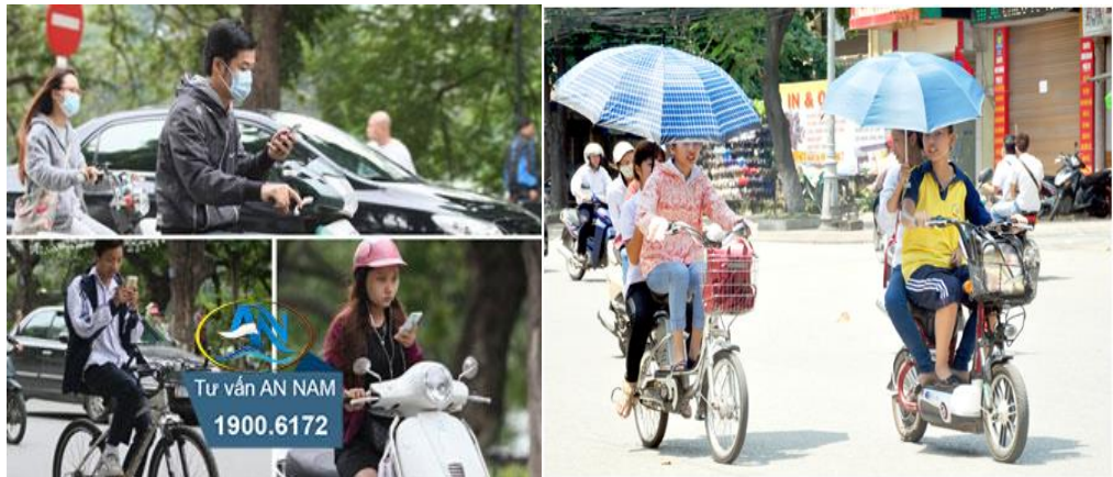
Hình ảnh: Sử dụng ô, điện thoại tai nghe khi đi xe