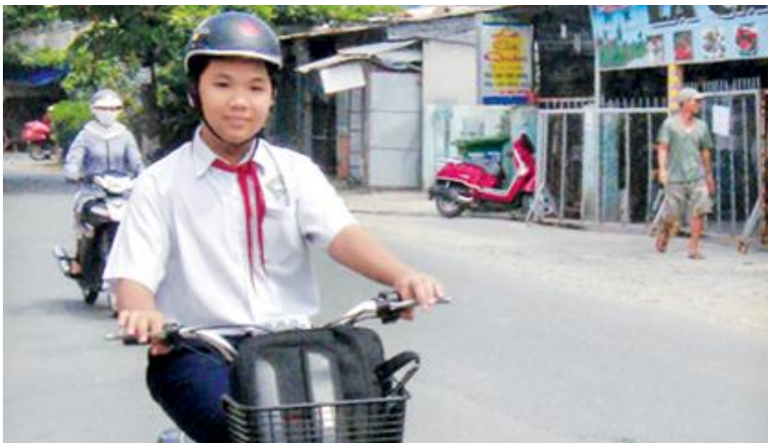
Hình ảnh: Đi xe đạp điện phải đội mũ bảo hiểm