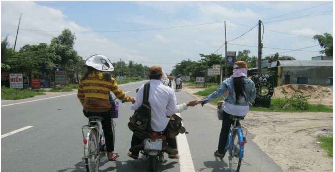
Hình ảnh: Kéo xe, bám đẩy các phương tiện