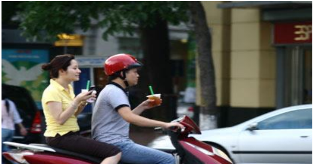
Hình ảnh: Đi xe vừa đi vừa ăn.