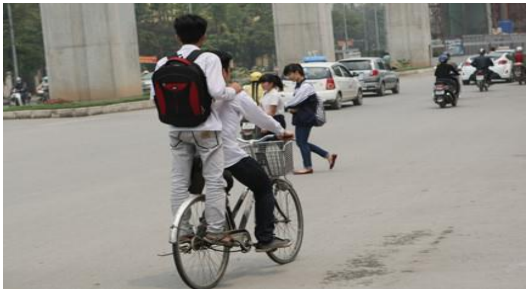
Hình ảnh: Đứng trên giá xe