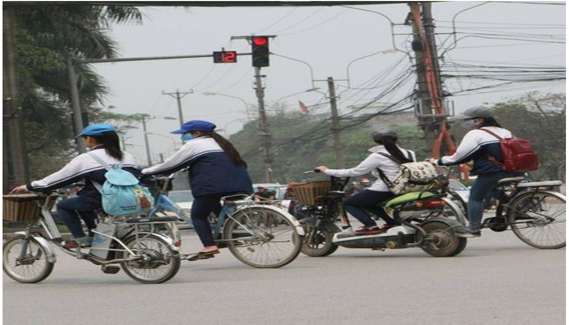
Hình ảnh: Đi xe vượt đèn đỏ không có tín hiệu để qua đường