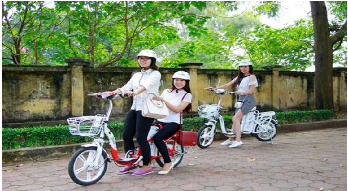
Hình ảnh: Đi xe trở đúng số người theo quy định