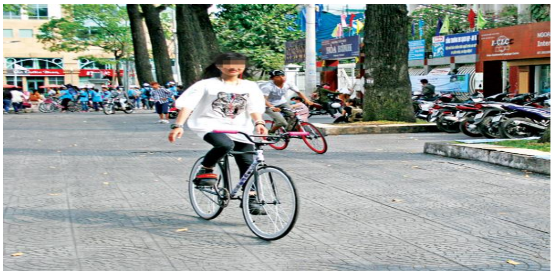
Hình ảnh: Đi xe bỏ tay