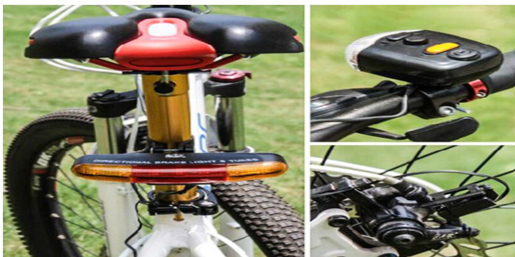
Hình ảnh: Xe phải có còi, phanh