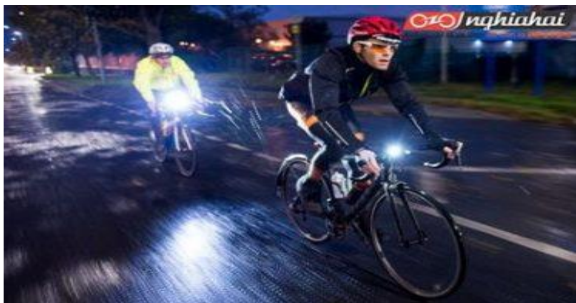
Hình ảnh: Đi xe buổi tối phải có đèn sáng