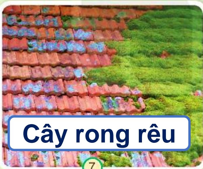
Cây rong rêu