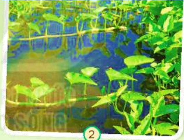
Cây rau muống