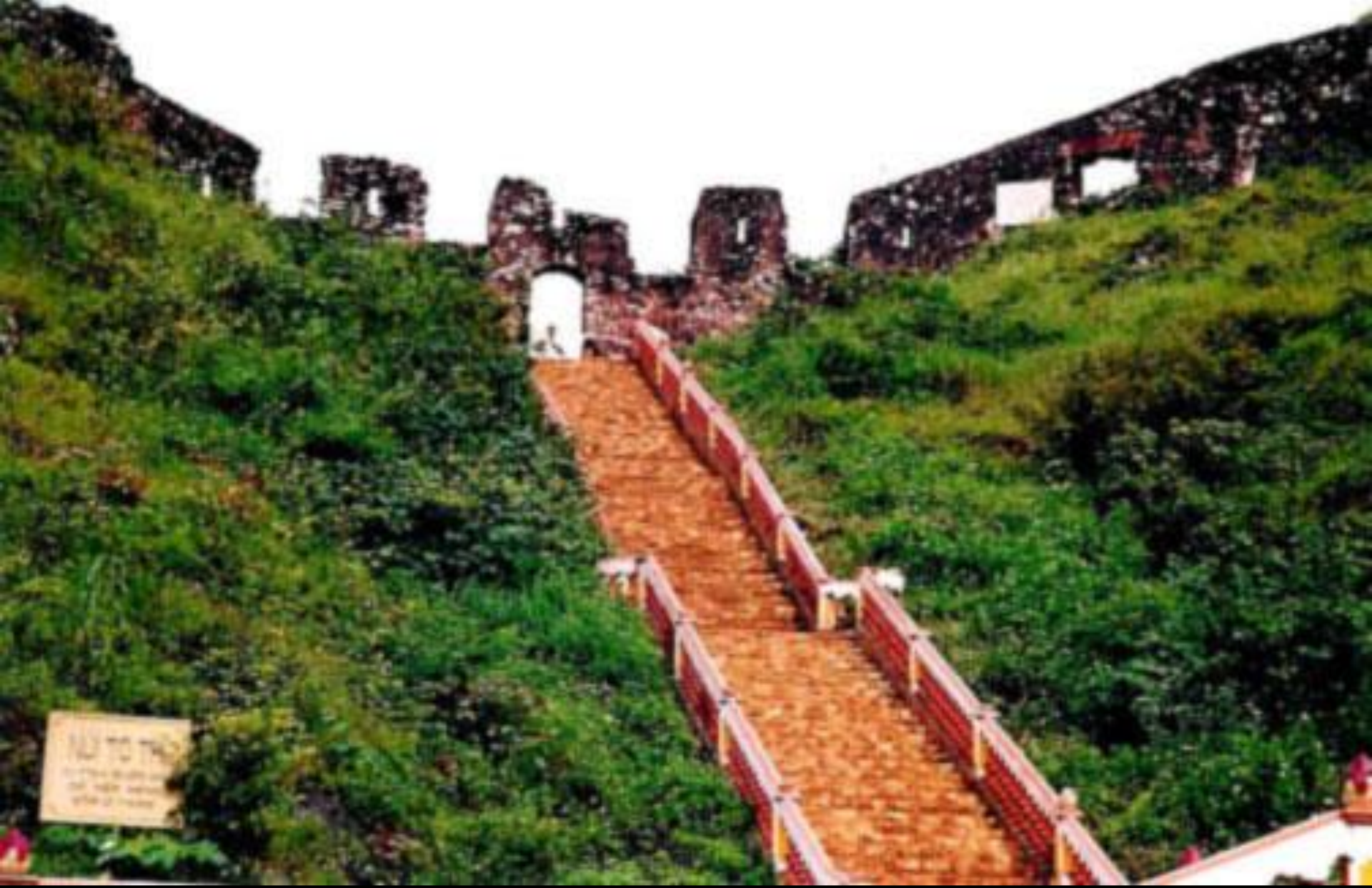
DI TÍCH THÀNH NHÀ MẠC