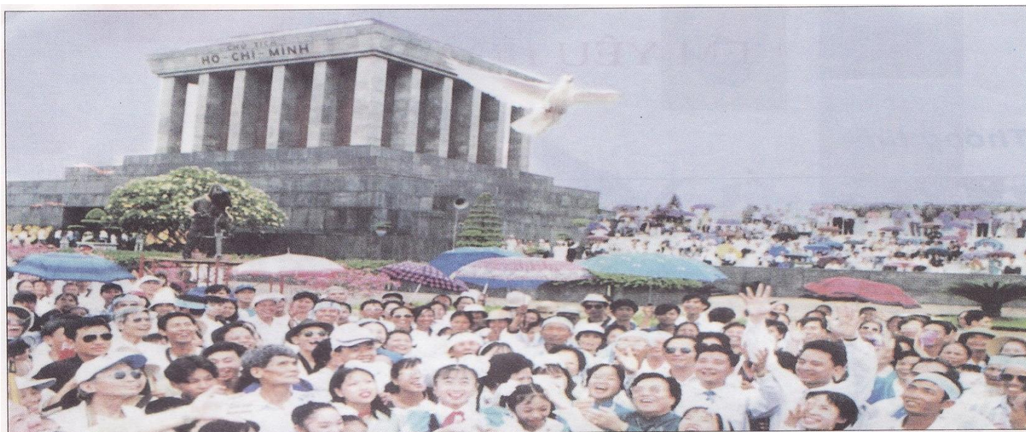
Phó Chủ tịch nước Nguyễn Thị Bình cùng nhân dân Hà Nội thả chim hoà bình trước Lăng Chủ tịch Hồ Chí Minh