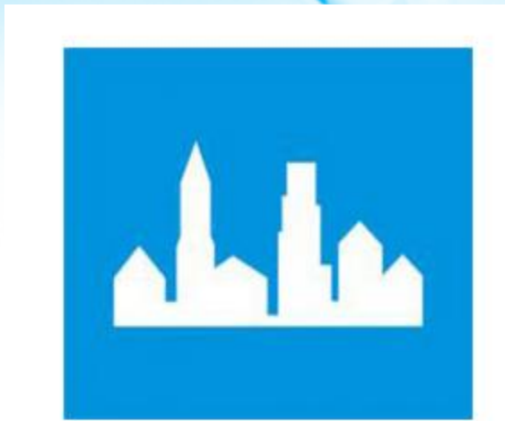
Biển báo bắt đầu khu dân cư