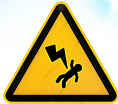
Biển báo nguy hiểm điện giật