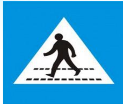
Biển báo đường dành cho người sang ngang