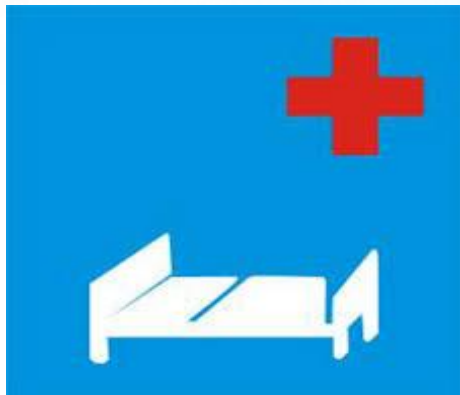
Biển báo bệnh viện