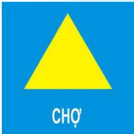
Biển báo chợ