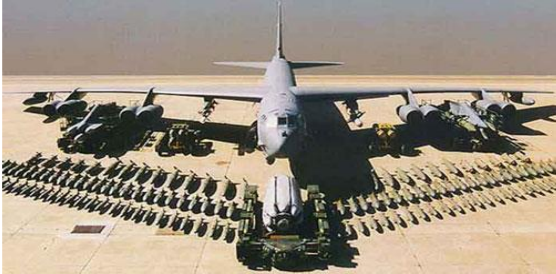
Máy bay B.52 và những vũ khí kèm theo