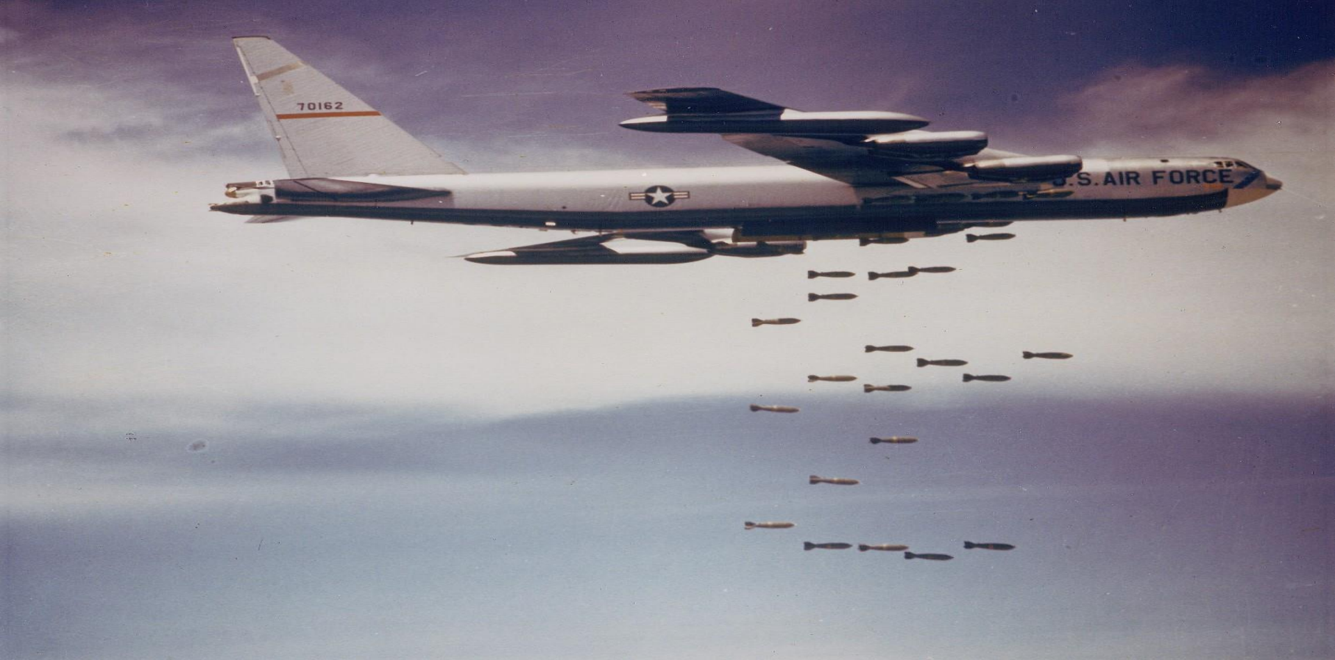
B.52 : Máy bay ném bom khổng lồ của Mỹ.