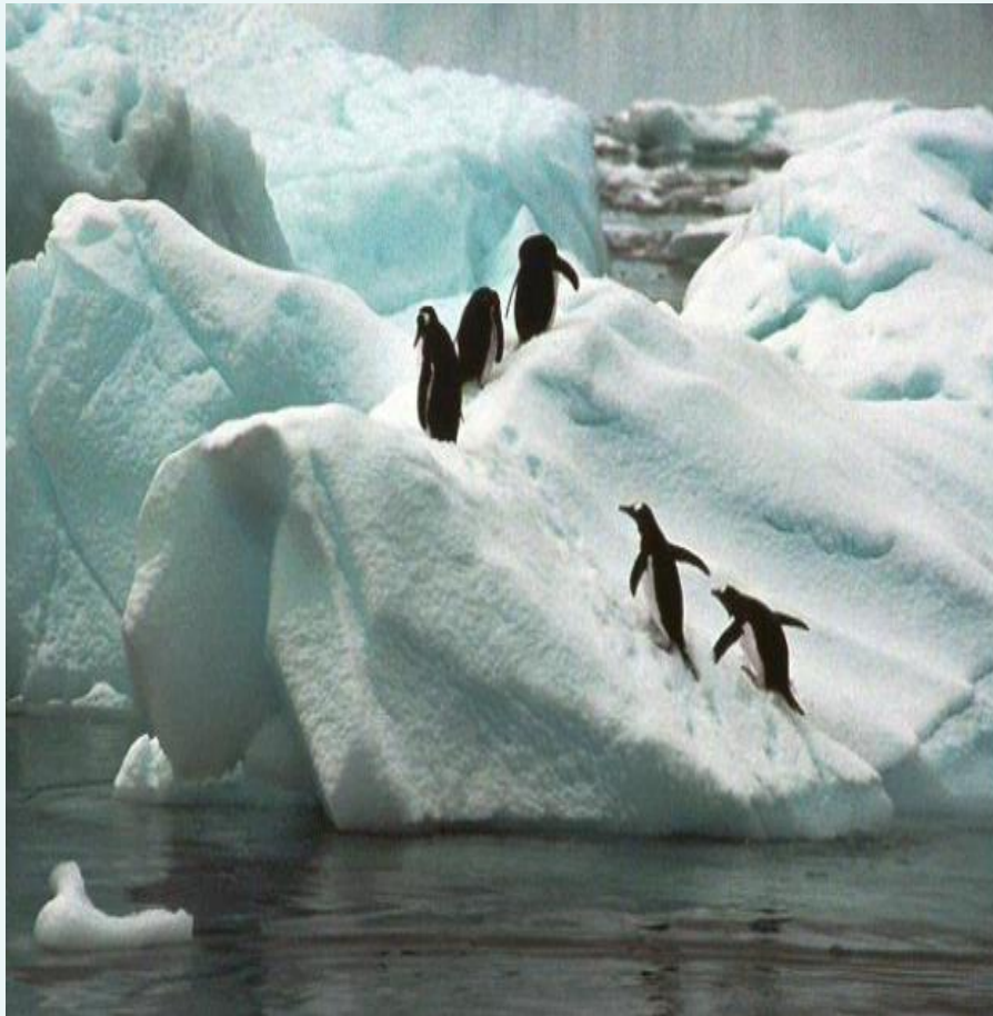
Chim cánh cụt

Câu 5 : Loài chim nào thường sống theo bầy đàn ?