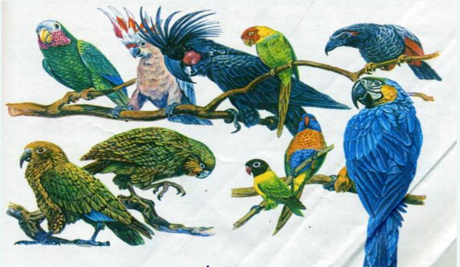
Một số loài chim vẹt