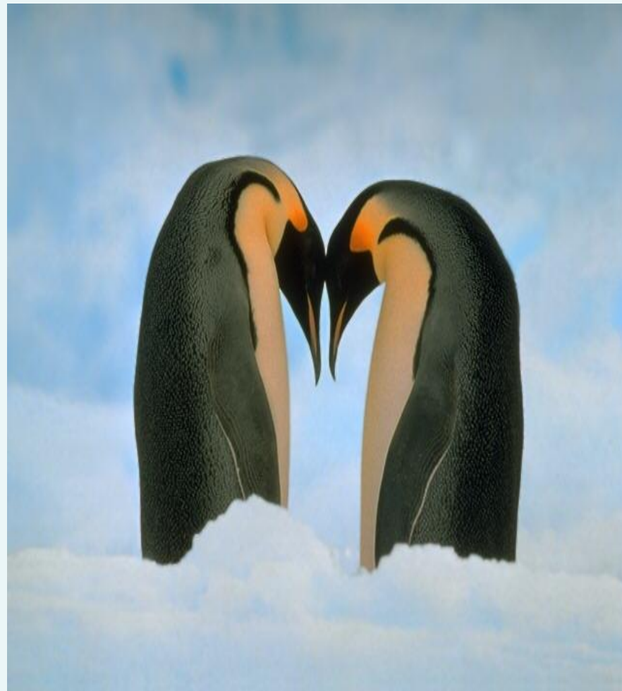
Chim cánh cụt