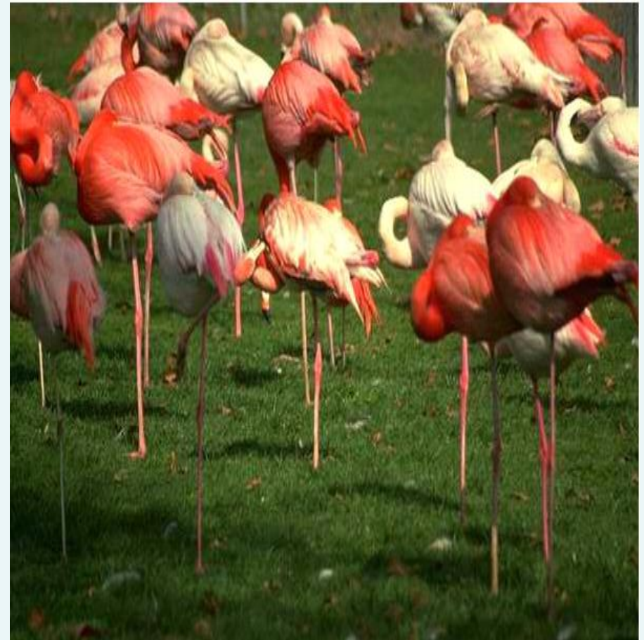
Sếu đầu đỏ