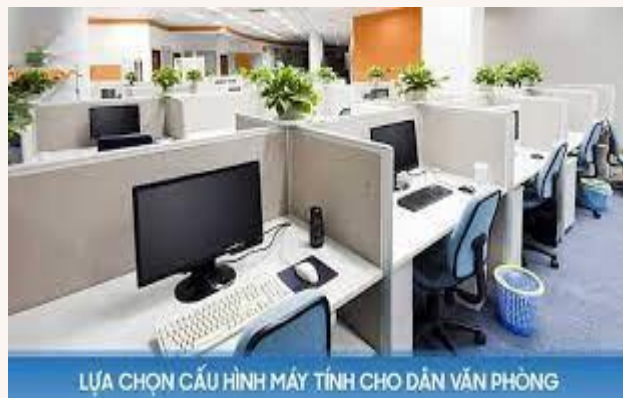
Máy tính được sử dụng trong văn phòng