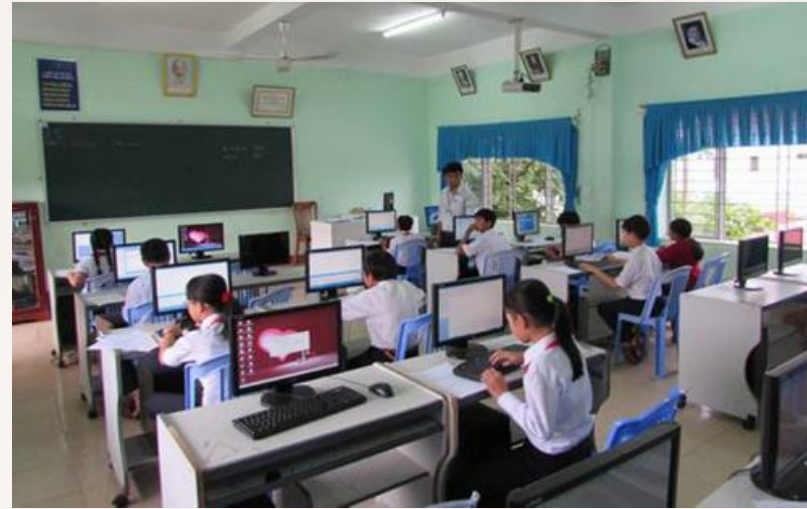
Hình 3 Máy tính được sử dụng trong trường học