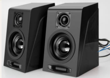
Loa máy tính