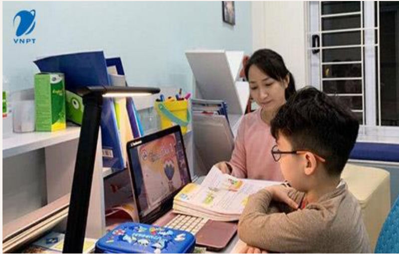
Hình 2 Máy tính được sử dụng trong gia đình