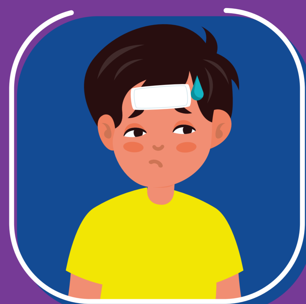
Sốt, mệt mỏi