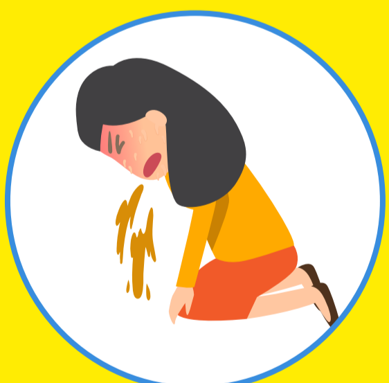
Buồn nôn hoặc nôn