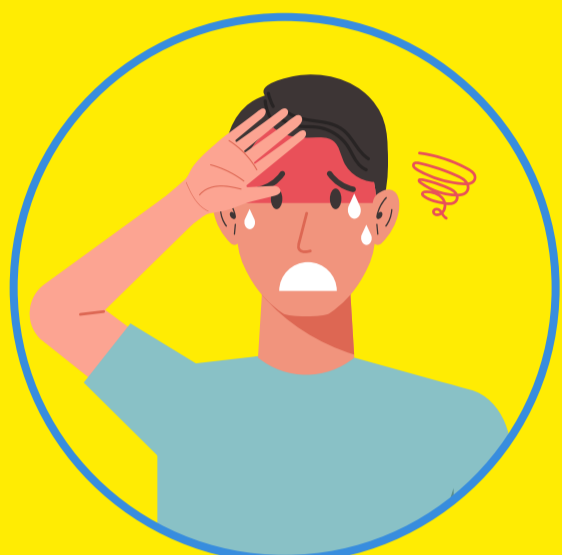
Hoa mắt Chóng mặt