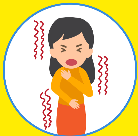
Co giật, ngất xỉu hoặc hôn mê