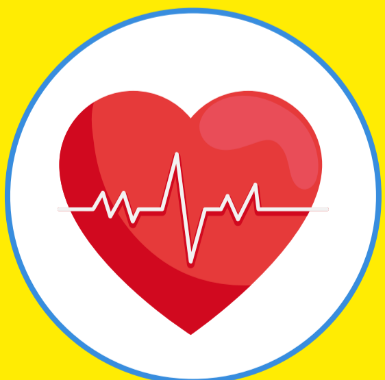
Tim đập nhanh, huyết áp tụt