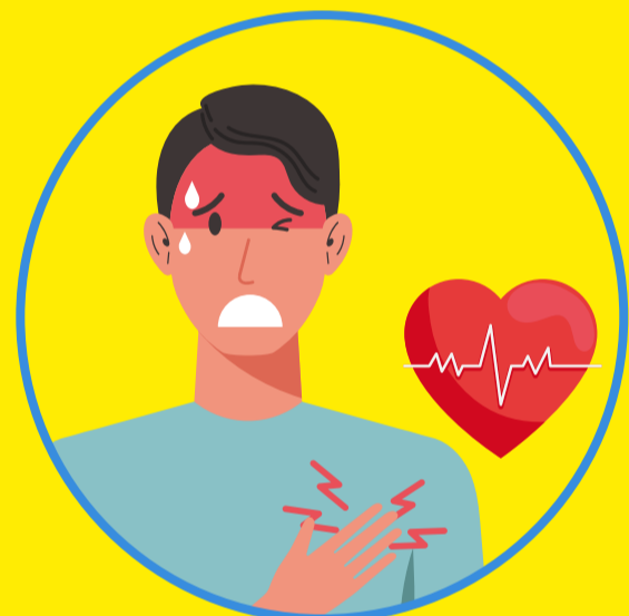
Tăng nhịp tim, nhịp thở Hồi hộp đánh trống ngực