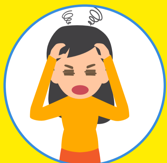
Đau đầu dữ dội Khó thở